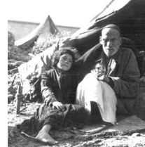
パレスチナ難民(パレスチナ人)

イスラエルでは、この戦争を独立戦争と呼んでいる。一方アラブ側は、同じ戦争を「大災害」と呼んでいる。