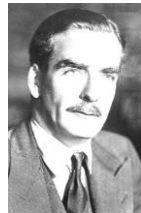
イギリス首相イーデン

ナイル川上流に建設された巨大なダム。スエズ戦争後、ソ連の援助により1971年に完成した。これ以後、ナイルの洪水はなくなった。