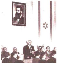
イスラエル建国宣言

初代首相ベン＝グリオンが、建国宣言を読み上げた。壁には、シオニズム運動の創始者ヘルツルの肖像画が掛けられている。