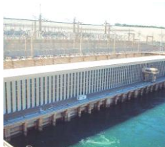
アスワン=ハイダム

ナイル川上流に建設された巨大なダム。スエズ戦争後、ソ連の援助により1971年に完成した。これ以後、ナイルの洪水はなくなった。