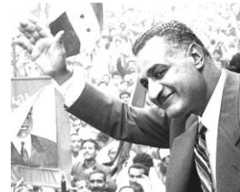
支持者に手を振るナセル

保守党出身。スエズ戦争失敗の責任を取り、辞任した。イギリスは、ついにスエズ運河を失ったのである。