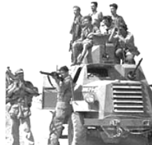
戦車に乗るイスラエル兵

初代首相ベン＝グリオンが、建国宣言を読み上げた。壁には、シオニズム運動の創始者ヘルツルの肖像画が掛けられている。