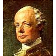
レオポルト2世 ヨーゼフ2世の弟で、マリー=アントワネットの兄にあたる。

・1791年8月、革命の激化を恐れたオーストリアのレオポルト2世とプロイセン王は、「国王に危害を加えた場合フランスに干渉する」と警告した。 ※これをピルニッツ宣言という。 →フランス国内では、反オーストリア感情が強まった。