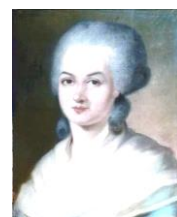
オランポ=ド=ゲージュ

正式には「人間および市民の権利の宣言」といい、全17条の宣言である。「アメリカ独立宣言」やルソーの影響が見られる。