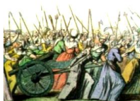
ヴェルサイユへ行進する女性

パンの値上がりに苦しむ女性たちは、ヴェルサイユ宮殿に乱入した。「男はバスティーユを奪い、女は国王を奪った」と言われた。