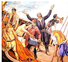
バルトロメウ=ディアス

探検に膨大な資金をつぎ込んだが、その動機については謎が多くよくわからない。船酔いが激しく、彼自身は一度も航海しなかった。