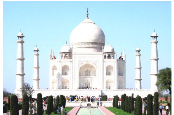
タージ=マハル シャー=ジャハーンが、愛妻の死を悼んで建設した。総大理石である。タージ=マハルとむかいあう形で、黒大理石の廟を建てる計画があったらしい。