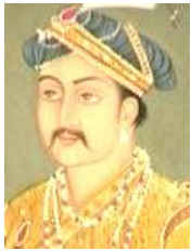
アクバル 第3代皇帝。その治世は、49年に及んだ。側近が『アクバル=ナーマ』という記録を残している。