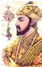
第5代皇帝シャー=ジャハーンと妻ムムターズ=マハルの間には、妻が36歳で病死するまでに14人の子供があった。アウラングゼーブはそのひとりである。