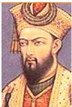
アウラングゼーブ 第6代皇帝。ムガル帝国の分裂を早めたことは間違いない。目つきが悪い！