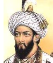
バーブル ティムールの直系の子孫である。回想録の『バーブル=ナーマ』を著した。