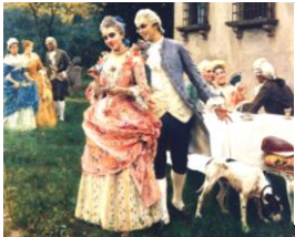
アフタヌーンティー

当時イギリスでは、午後に紅茶を飲むことが大ブームとなっていた。そのためイギリスは、中国から茶を大量に輸入していた。