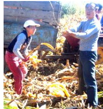
中国のトウモロコシ

当時イギリスでは、午後に紅茶を飲むことが大ブームとなっていた。そのためイギリスは、中国から茶を大量に輸入していた。