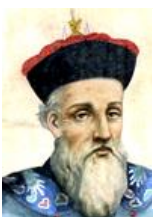
フェルビースト(南懷仁)

( ) …イタリア人宣教師で（ ）の設計を行った。 また西洋絵画の画法で乾隆帝の肖像画を描いた。