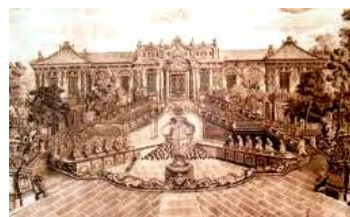
廃墟となる前の圓明園

『皇輿全覽図』は、初めて実測を行って作られた中国の地図である。『坤輿万国全図』とは違い、世界地図ではないので注意。