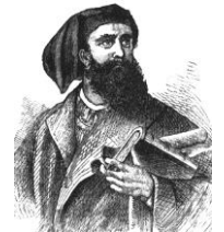
マルコ=ポーロ ヴェネツィア出身と言われ るが、非常に謎が多い。