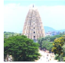
ハンビのヒンドゥー教寺院

沖縄の伝統的な染色技法である紅型は、中国の装飾、日本の友禅、ジャワ島のバティックなどの影響がある。沖縄文化は多様な文化が混合して成り立っている。