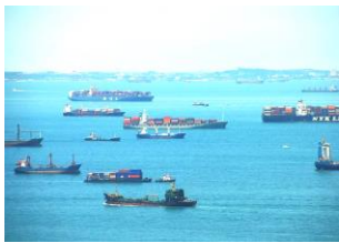
現在のマラッカ海峡

マレー半島とスマトラ島に挟まれたマラッカ海峡は、東アジアとインドを結ぶ最短ルートであり、現在も多くのタンカーが行き来する場所である。