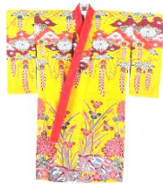
沖縄の紅型(びんがた)

マレー半島とスマトラ島に挟まれたマラッカ海峡は、東アジアとインドを結ぶ最短ルートであり、現在も多くのタンカーが行き来する場所である。