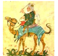
イブン=バットゥータ 14世紀の大旅行家である。