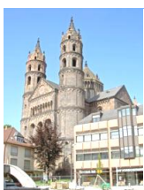
ヴォルムス大聖堂

協約により、叙任権そのものはローマ教皇が持つが、帝国内の教会領に対する権威は、皇帝が持つこととなった。この大聖堂は、ロマネスク様式の傑作として有名。