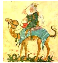
イブン=バットウータ

中国で最初にカトリックを布教したことで名高いフランチェスコ派の修道士である。「中国で最初にキリスト教を布教した」わけではないので注意。