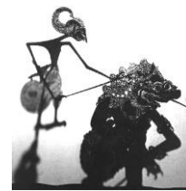
ジャワ島では、クディリ朝のころからワヤンと呼ばれる影絵芝居が発展した。インドの影響が強く、『マハーバーラタ』や『ラーマヤナ』が主に演じられた。