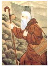
モンテ=コルヴィノ

元ではウイグル文字をもとにしたモンゴル文字を公用語としていたが、パスパ文字も公文書などに使用された。しかし一般には普及しなかった。