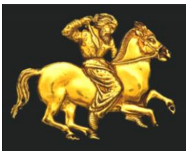
スキタイの装飾品

スキタイはイラン系の民族と言われ、その特徴はヘロドトスの『歴史』に詳しく書かれている。黄金製の装飾品が多数出土しており、高度な文化がうかがえる。