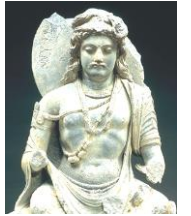
ガンダーラ菩薩像