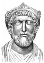
ユリアヌス わずか即位3年 で、ササン朝と の戦いの際に戦 死してしまった。

現在でもイスタンブールには、コンスタンティヌスが建てた首都移転の記念柱が立っている。またローマ(後にビザンツ)時代の城壁もかなり残されている。