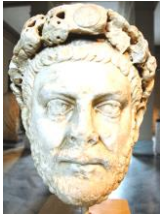
ディオクレティアヌス 無事に引退できた 久しぶりの皇帝と なった。晩年はキ ャベツ作りにはま っていた。