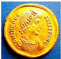
テオドシウス 大病をわずらったことが、キリスト教に熱心になるきっかけとなった。