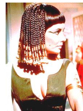
映画『クレオパトラ』

映画のワンシーンからとってみました。ヘレニズム時代は、アレクサンドロスからクレオパトラまでと覚えよう。映画を見ておくと、さらに覚えやすい。