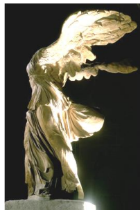
「サモトラケのニケ」

ヴィーナスは、ギリシア語のアフロディーテ。美と愛の女神である。発見当初から腕は欠けており、それが人々の想像力をかきたててきた。パリのルーヴル美術館にある。