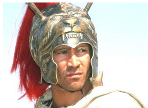
映画『アレキサンダー』