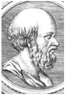
エラトステネス 地球が丸いことを、科学的に証明したとも言える。