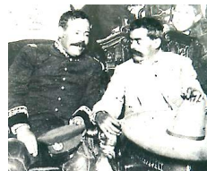
ビリャ(左)とサパタ(右)

裕福な家庭に育ち、ディアスの独裁政権を倒した。しかしすぐにクーデターが発生し、暗殺された。