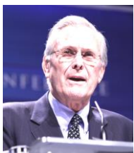
ラムズフェルド国防長官

ブッシュがアフガニスタンやイラクを攻撃した背景には、ラムズフェルドのような、新保守主義者(ネオコン)と呼ばれる人たちの影響があったとされる。