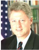
クリントン 女癖が悪く、在任中に浮気がばれた。