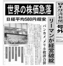
リーマン=ショックを報じる新聞

クリントン元大統領の妻で上院議員。民主党の指名争いでオバマに敗れた。オバマ政権では国務長官を務め、2016年の大統領選挙に再び立候補したが、トランプに敗れた。