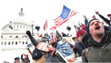
アメリカ議会襲撃事件

不動産業で大富豪となり、テレビタレントして有名になった。2020年の大統領選挙ではバイデンに敗れたが、2024年の再挑戦を表明している