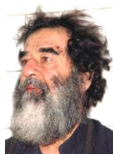
捕えられたサダム=フセイン

ブッシュがアフガニスタンやイラクを攻撃した背景には、ラムズフェルドのような、新保守主義者(ネオコン)と呼ばれる人たちの影響があったとされる。