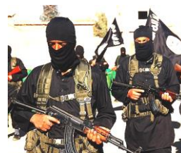
「イスラム国(ISIL)」の兵士

フセインは、2003 年に逃亡先で捕えられた。獄中ではアメリカ兵とも積極的に交流し、イメージとは違って紳士的な人物であったとされている。2006 年に処刑された。