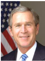
ブッシュ(子) 第 43 代大統領。 イラク戦争の混迷で、人気を失った。趣味はサインボール集め。