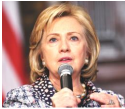
ヒラリー=クリントン

クリントン元大統領の妻で上院議員。民主党の指名争いでオバマに敗れた。オバマ政権では国務長官を務め、2016年の大統領選挙に再び立候補したが、トランプに敗れた。