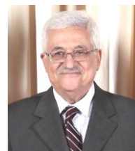
パレスチナ自治政府のアッバース議長

アル=カーイダの指導者。元はアフガニスタンでソ連と戦っていた。長らく生死不明だったが、2011 年にアメリカによって殺害された。