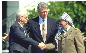
パレスチナ暫定自治協定(オスロ合意)

写真はイスラエルの戦車に石を投げるパレスチナ人の少年。1980年代から90年代にかけて、頻繁に行われたが、イスラエルはこれを弾圧した。