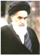
イランのホメイニ シーア派のウラマー の最高位であり、イラン 革命の指導者であ った。