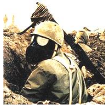
イラン=イラク戦争

30年以上イラクで独裁的な地位にあった。イラン=イラク戦争ではアメリカと親密な関係であり、それが湾岸戦争における誤算をまねいた。