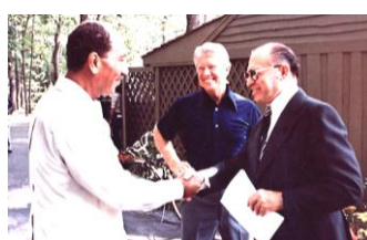
キャンプ=デーヴィッド合意

自由将校団の結成メンバーで、ナセルの盟友。イスラエルとの和平は、中東地域のある程度の安定にはつながったが、彼の命を縮めた。