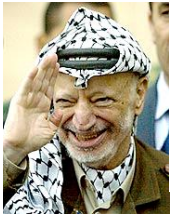
PLOのアラファト議長

1969年にPLOの議長となり、ゲリラ活動を行った。1982年にイスラエルによって拠点のレバノンを追われた後は、対話路線に転じた。2004年に死去。