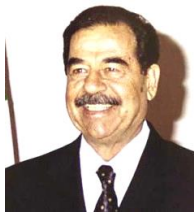
イラクのフセイン大統領

30年以上イラクで独裁的な地位にあった。イラン=イラク戦争ではアメリカと親密な関係であり、それが湾岸戦争における誤算をまねいた。