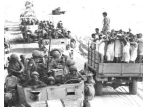
第3次中東戦争(6日間戦争)

1969年にPLOの議長となり、ゲリラ活動を行った。1982年にイスラエルによって拠点のレバノンを追われた後は、対話路線に転じた。2004年に死去。