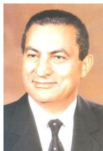
エジプトのムバラク大統領

サダト暗殺時は、副大統領としてサダトのとなりだったが、奇跡的に助かった。2011年の「アラブの春」で独裁者の地位から滑り落ちた。