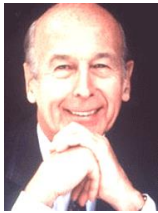
ジスカールデスタン