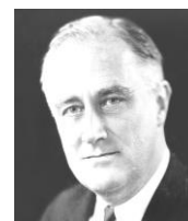
F=ローズヴェルト ニューディール政策を進めていたが、景気回復にはほど遠かった。本音では景気回復のために、日本との戦争を望んでいたとされる。