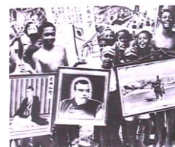
皇民化政策の宣伝写真

「マレーの虎」と呼ばれた山下中将は、「降伏、イエスカノーか？」と、シンガポールの守備隊に迫ったとされる。