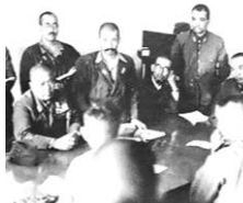
シンガポール占領

写真は沈む戦艦アリゾナ。宣戦布告文書の翻訳が遅れ、結果的に奇襲となってしまった。このことはアメリカ人の反日感情を大いに高めた。