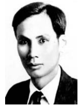
ホーチミン グエン=アイ=クオクと名乗っていたフランス留学時代の写真。清廉な人柄で知られる。