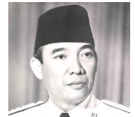
スカルノ インドネシアの独立運動の指導者。デヴィ夫人の夫である。