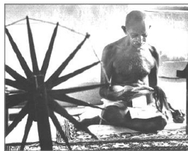
糸車を回すガンディー

考え方に若干の違いはあったが(ネルーの方が急進的)、最後まで関係は良好だった。なおネルーの子や孫も、後にインドの首相となった。