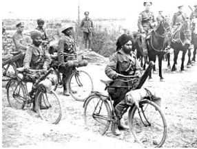
イギリス軍のインド兵

→1919年、ローラット法に抗議して開かれた集会にイギリス軍が発砲し、多数の死傷者を出す（ ）が起こった。