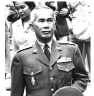
ピブン タイの首相として政治の実権をにぎった。