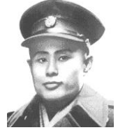
アウンサン 名前からわかるとおり、あの人の父である。後に非業の死をとげた。