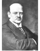
ドイツのシュトレゼマン ロカルノ条約締結時は外相で、ノーベル平和賞も受賞した。ヴァイマル共和国が一番安定していた時代の政治家である。