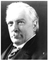
ロイド=ジョージ 第一次世界大戦中に、挙国一致内閣の首相を務めた。自由党からの最後の首相となった。