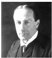
ボールドウィン このころから、保守党と労働党の二大政党制が成立してきた。