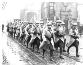
進軍するフランス兵

ルール地方はライン川の流域にあり、豊富な石炭に恵まれたドイツ有数の工業地帯である。ドイツ人は仕事をサボることで占領に抵抗した。