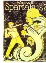
カール=リープクネヒト

スパルタクス団の名は、古代ローマで反乱を起こしたスパルタクスにちなむ。反戦と革命を強烈に主張していた。