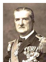
ホルティ 共産主義勢力を倒し、独裁者となった。 後にナチスに接近したため失脚した。