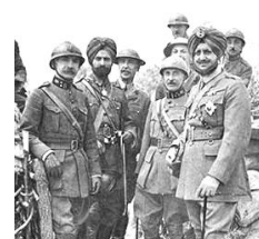
イギリス軍のインド兵

軍需工場以外にも、電車の運転士や電話の交換士など、それまで男性が担っていた仕事の多くを、女性が務めるようになった。