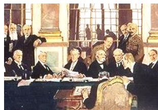
ヴェルサイユ条約の調印

ドイツに対して、非常に厳しい姿勢で臨んだ。「ドイツの方角をにらんだまま、立った姿勢で葬ってほしい。」と遺言した。