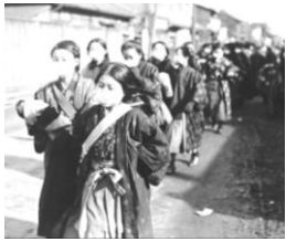
スペイン風邪の流行

インフルエンザの一種であるスペイン風邪は、1918年から1920年にかけて大流行し、最大1億人が亡くなった。第一次世界大戦末期の混乱や情報統制も流行の要因とされる。写真はマスク姿の日本人女学生。