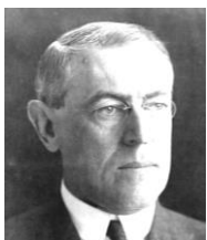
アメリカのウッドロー=ウィルソン

民主党の大統領で、十四ヶ条とてにかく有名。ディスレクシアという学習障害を持っており、読み書きが苦手であった。