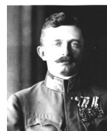
オーストリア皇帝カール1世 名門ハプスブルク家も、彼の代でついに皇帝の位を降りた。