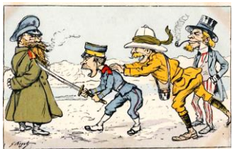
日露戦争の風刺画