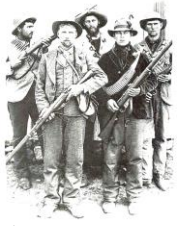
ブルル人のゲリラ 逃げるイギリス軍