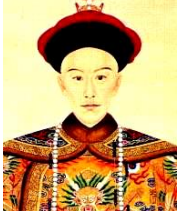
光緒帝 第 11 代皇帝。さわやかな青年皇帝である。理想を追い求めすぎた。