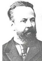
ロシア代表ウイッテ

日露戦争は、日本史の大きな転換点となったが、世界史の視点から見ると重要な出来事である。とりあえず「坂の上の雲」を観よう(読もう)。