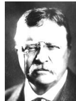
アメリカ大統領 T=ローズヴェルト

日露戦争後は、首相として外国資本の積極的な導入などロシアの近代化に努力したが、反対派によって失脚した。