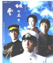
ドラマ「坂の上の雲」

日露戦争は、日本史の大きな転換点となったが、世界史の視点から見ると重要な出来事である。とりあえず「坂の上の雲」を観よう(読もう)。