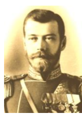
ロシア皇帝ニコライ2世

当時イギリスは、南アフリカ戦争(ブール戦争)で大苦戦しており、義和団事件の際は大軍を派遣できなかった。これが日本との同盟につながる。第145回を見よう。