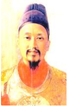
高宗 コジョンと読む。優秀な王ではない。