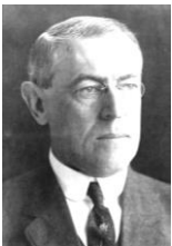
ウッドロー=ウィルソン