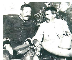
ビリャ(左)とサパタ(右)

裕福な家庭に育ち、ディアスの独裁政権を倒した。しかしすぐにクーデターが発生し、暗殺された。