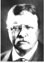
T=ローズヴェルト 第26代大統領で、 テディの愛称で知られる。