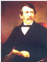
リヴィングストン

宣教師でもあり、アフリカ探検はキリスト教布教という目的もあった。また黒人奴隷の解放運動でも活躍した人物である。