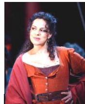
ビゼー作「カルメン」

エジプトを舞台にした「アイーダ」はヴェルディの最高傑作である。スエズ運河開通直後に完成。