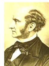
ジョン・ステュアート・ミル

「インターナショナル」という言葉は、彼が創った言葉である。ちなみに遺体は遺言により、ロンドン大学の棚に保管されている。ただし頭だけは蠟で作られたレプリカ。