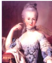
マリー=アントワネット

元々は弁護士をしていた。賄賂を一切受け取らず、異常なまでにマジメな性格だった。死ぬまで童貞だったといわれる。