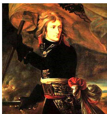
「アルコレ橋上のナポレオン」

アルコレ橋でオーストリア軍と戦ったナポレオンは、総司令官であるにもかかわらず、銃弾の嵐の中を突っ走った。ナポレオン伝説は、このイタリア遠征から始まる。このころはまだ痩せていてカッコいいですね。