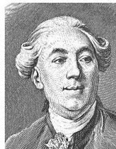
財務総監ネッケル

重農主義者として知られる。第 107 回を復習すること。宮廷費を節約しようとして、マリー=アントワネットたちの大反発をくった。ギルドの廃止も計画していた。