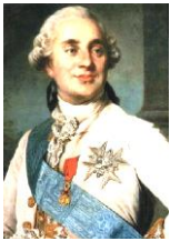
ルイ 16 世

ちょっとオタクっぽい、まがいなくいい人である。改革にも積極的だったが、もはや彼が即位した時には手遅れの状態であった。生まれた時代が悪かったな。哀れ…。