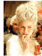
映画『マリー=アントワネット』 マンガ『ベルサイユのばら』

政略結婚でフランスに嫁いできた。母はもちろんマリア=テレジア。豪華な宮廷生活は民衆の恨みをかい、赤字夫人などと呼ばれた。興味のある人は、映画やマンガにふれてみよう。