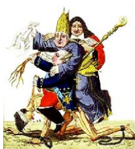
アンシャン=レジームの風刺画