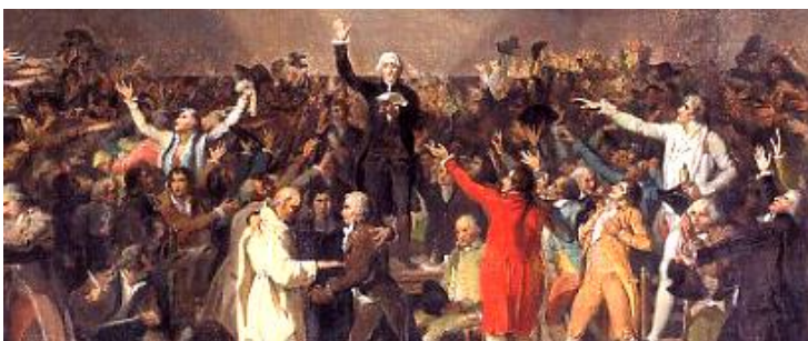
ダヴィド作「テニスコートの誓い」

→ルイ 16 世はしぶしぶこれを認めたため、国民議会は憲法制定議会と名をあらためて憲法の制定にとりかかった。