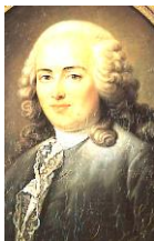
財務総監テュルゴー

重農主義者として知られる。第 107 回を復習すること。宮廷費を節約しようとして、マリー=アントワネットたちの大反発をくった。ギルドの廃止も計画していた。