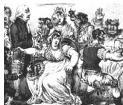
ジェンナーの種痘

ジェームズ1世やチャールズ1世の侍医を務めていたため、革命では王党派だった。「心臓はポンプにすぎない！」