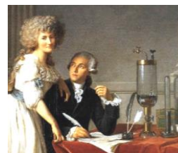
ラヴォワジエと妻

近代物理学の祖であるが、錬金術師でもあった。17世紀のベスト流行で大学が閉鎖となったわずか1年半の間に、万有引力の法則や微積分法を発見した。