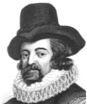
フランシス＝ベーコン

中世のスコラ学者であるロジャー＝ベーコンと間違えないように。冷凍技術の実験で、雪の日に外に出ていたため、風邪をひいて死んだ。