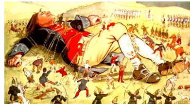
『ガリヴァー旅行記』の挿絵

ピューリタン革命に参加したため、王政復古後は、何度も投獄された。本職は聖職者である。