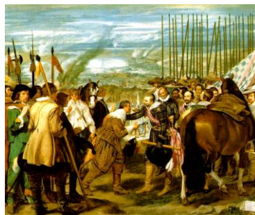
ベラスケス作「ブレダの開城」

エル=グレコとは「ギリシア人」の意である。暗く印象的な色使いの絵で、人物は縦に細長く描かれるのが特徴。神秘的というより不気味な印象を受ける。