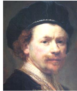
レンブラント作「自画像」

多くの受験生が、ファン=アイク兄弟と混同するが、別人である。本人いわく、この絵を描いた時、すでにチャールズ1世の処刑を予感していたとか。まあ嘘ですね(笑)