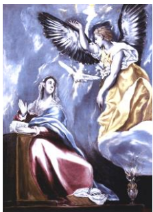
エル=グレコ作「受胎告知」

エル=グレコとは「ギリシア人」の意である。暗く印象的な色使いの絵で、人物は縦に細長く描かれるのが特徴。神秘的というより不気味な印象を受ける。