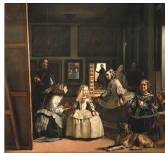
「ラス=メニーナス(女官たち)」

「ブレダの開城」は、私が高校生のころの『世界史詳覧』に大きく載っていたので、本物を見たときは感動した。ただ「ラス=メニーナス」の方が有名。ベラスケスを見るなら、マドリードのプラド美術館に行くべき。