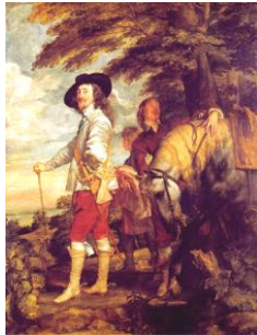
ファン=ダイク作「英国王チャールズ1世の肖像」

アントウェルペンの大聖堂にある。『フランダースの犬』でネロが見たかった絵は、この絵である。十字架から降ろされるイエスが描かれている。