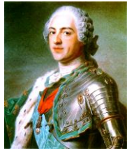
フランス王ルイ15世

ルイ14世のひ孫で、後を継いだ。しかし政治には関心がなく、愛人ボンパドゥール夫人の政治介入をまねいた。戦争と贅沢により、フランスの財政は破たん状態となった。