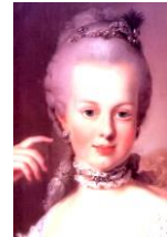
マリー=アントワネット

ルイ15世の王太子であった。いわゆるオタク的な性格で、自分の趣味に引きこもる傾向があった。いい人だとは思いますが、生まれる時代が悪すぎた…。