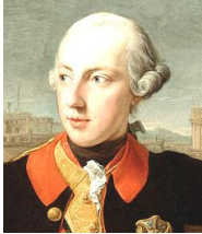
ヨーゼフ2世 イケメンで人間性もよかつたが、「一歩目より先に二歩目が出る男」と評された。

→1770年、マリア=テレジアの末娘（ ）と、フランスの王太子ルイ（後の ）を結婚させた。