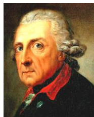
プロイセンのフリードリヒ大王

さすがのフリードリヒ大王も、七年戦争では自殺を覚悟したらしいが、最後にまさかの展開となった。これは「ブランデンブルクの奇跡」と呼ばれている。