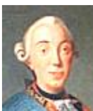
ロシア皇帝ピョートル3世

さすがのフリードリヒ大王も、七年戦争では自殺を覚悟したらしいが、最後にまさかの展開となった。これは「ブランデンブルクの奇跡」と呼ばれている。