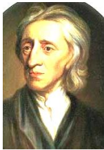
ロック 中学の社会でも登場するくらい有名な方。