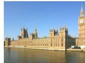
イギリスの国会議事堂

第79代首相。2022年トラス首相の後を継いで保守党党首となり、イギリス首相となった。初のインド系でヒンドゥー教徒の首相。イギリスとインドの関係を考えると感慨深いものがある。