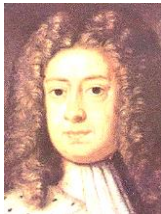
ジョージ1世 家庭は崩壊しており、妻や息子との関係は最悪だった。