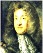
ジェームズ2世 悪役のイメージが強いが、 再評価されつつある。