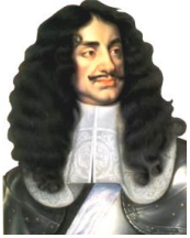
チャールズ2世 処刑されたチャールズ1世の息子。髪型がすてき。女好き。