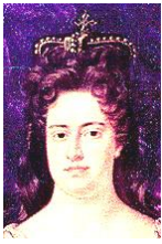
アン女王 子供に次々と先立たれた。抗リン脂質抗体症候群という病気だったらしい。