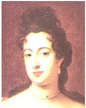
メアリ2世 ジェームズ2世の娘である。政略結婚でオランダに嫁いでいた。