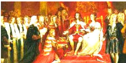
夫妻は寛容法を制定し、プロテスタントの信教の自由も認めた。2人の結婚は政略結婚であり、夫婦仲はよくなかったとされる。そのため子供はできなかった。