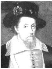
ジェームズ1世 スコットランド王としてはジェームズ6世。血筋的には、ヘンリ7世の孫の孫にあたる。