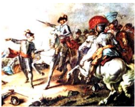
ネーズビーの戦い

鉄騎隊を率いるクロムウェルは、議会派の副司令官を務めた。この戦いの結果、議会派の勝利は決定的となった。イギリス革命の趨勢を決めた一戦である。