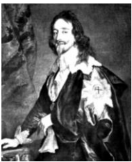
チャールズ1世 兄が早死にしたため、王位を継承した。議会に理解のあった兄が王であれば、革命は起きなかったかもしれない。