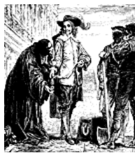
チャールズ1世の処刑

鉄騎隊を率いるクロムウェルは、議会派の副司令官を務めた。この戦いの結果、議会派の勝利は決定的となった。イギリス革命の趨勢を決めた一戦である。