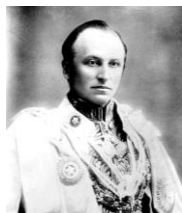
インド総督カーズン

イギリス統治下で、社会改革運動を行った。特に夫を失った女性の殉死であるサティーの禁止は、彼の功績である。サティーは現在でもたまにニュースになる。