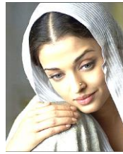
ラクシュミー=パーイー(映画)

シパーヒーの反乱のきっかけは、支給された銃の火薬の包み紙であった。インドにおける宗教を、しっかり理解しておこう。食べてはいけない動物何だっけ？