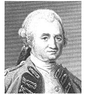
亀をペットとして飼っていた。初代ベンガル知事となった。