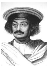
ラーム=モーハン=ローイ

イギリス統治下で、社会改革運動を行った。特に夫を失った女性の殉死であるサティーの禁止は、彼の功績である。サティーは現在でもたまにニュースになる。