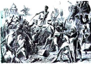
シパーヒーの反乱

シパーヒーの反乱のきっかけは、支給された銃の火薬の包み紙であった。インドにおける宗教を、しっかり理解しておこう。食べてはいけない動物何だっけ？