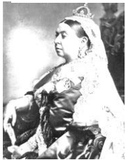
ヴィクトリア女王 インド皇帝となったが、一度もインドには来なかった。

バールにはじまるムガル帝国も、ついに滅んでしまった。彼は殺されずに、ミャンマーへ追放された。