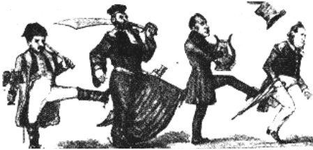
フランス政体の変遷の風刺画 右の七月王政から、左の第二帝政に至る、権力者の移り変わりを表している。全員わかるかな？