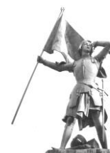
ジャンヌ=ダルク像

実現はしなかったが、史上初の女性参政権を規定するなどした。激しい弾圧で、パリ=コミュンは3万人の死者を出して崩壊した。