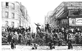
バリケードを作るパリ市民

ボルドーに国民議会を招集し、臨時政府を成立させた。激動の19世紀フランスを生き抜いた政治家である。