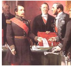
オスマン知事(右端) パリがあるセーヌ県の知事として、都市の整備を行った。左端はナポレオン3世。