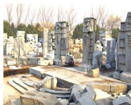
破壊された円明園

ロシアはクリミア戦争の敗戦で、伝統の南下政策が大きな打撃を受けた。思い悩んだニコライ1世はうつ病になり、戦争中に急死。国際関係が複雑なので、第128回で詳しくやります。