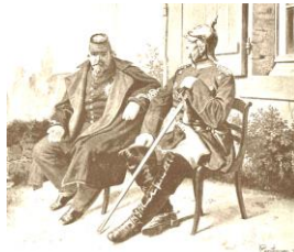
ナポレオン3世とビスマルク

フランスに見捨てられたマクシミリアンは、メキシコ兵に捕えられて、処刑された。印象派の画家マネは、絵画の一部をわざと事実と異なるように描き、ナポレオン3世を非難した。