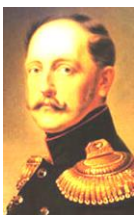
ロシア皇帝ニコライ1世

ロシアはクリミア戦争の敗戦で、伝統の南下政策が大きな打撃を受けた。思い悩んだニコライ1世はうつ病になり、戦争中に急死。国際関係が複雑なので、第128回で詳しくやります。