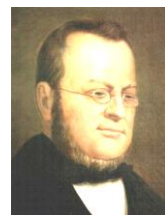
サルデーニャ王国宰相カヴール

アロー戦争により、乾隆帝がカスティリオーネに建てさせた円明園は、完全に破壊された。現在も廃墟の状態で一般公開されている。第76回、146回を勉強しよう。